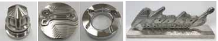
CVJパンチ コンロッド型 ハブ型サンプル 南海鋼材ロゴの直彫りオブジェ この他、クランク型等も全て高度な直彫り製作を可能にしている。